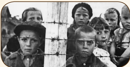
ילדים יהודים בשואה

הם ביקשו להשפיל, אך העוצמה היהודית היתה חזקה מהם.